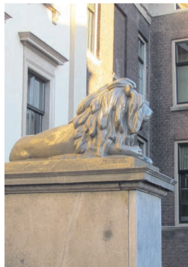
De leeuwen naast de trappen staan te glimmen. Toch is er meer aan de hand dan het lijkt