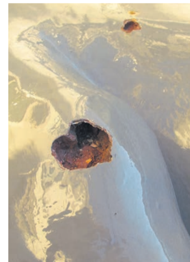
De leeuwen zijn niet van steen. Oude reparaties in het metaal schreeuwen om aandacht