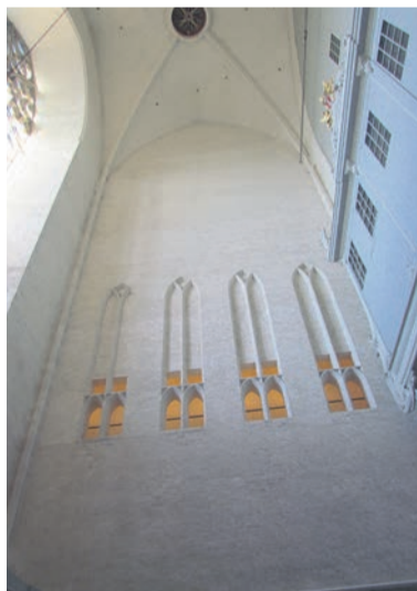
De proeven met Keim moeten een vervolg krijgen voor de overige witte stenen wanden