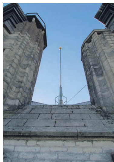
Voordat de stalen mast voor onderhoud aan de beurt is, moet die eerst gekanteld worden