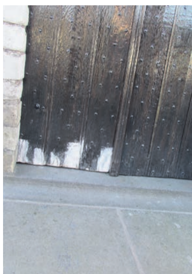
Niet alleen regulier schilderwerk maar ook waar nodig deelvervanging van aangetast houtwerk