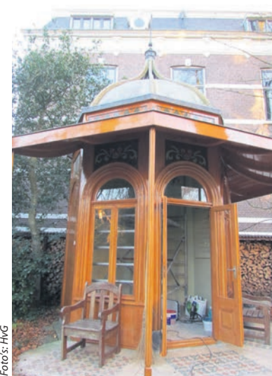
Ook het houtimitatiwerk aan dit theehuis behoort tot de expertise van het schildersbedrijf