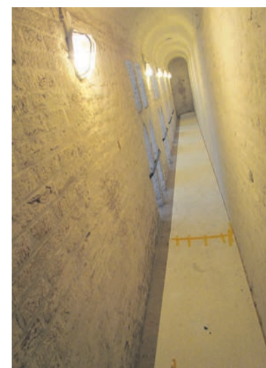
In enkele tochtluizen hoog in de toren zet Nijhoff enkele proeven op met Keim