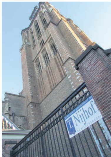
Niet te uitbundig maar terughoudend laat het schildersbedrijf weten dat ze er aan het werk zijn