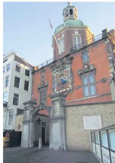
Volgend jaar start het schildersbedrijf met het onderhoud aan de Groothoofdspoor